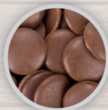
МОЛОЧНЫЙ ШОКОЛАД МОНЕТКИ 35 % КАКАО-МАССА