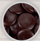
ЧЕРНЫЙ ШОКОЛАД МОНЕТКИ 56 % КАКАО-МАССА

Установить режим микроволновой печи на малую мощность (не более 400 Вт); периодически помешивать шоколад до получения однородной массы.