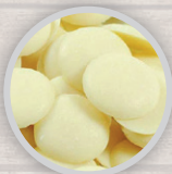
БЕЛЫЙ ШОКОЛАД МОНЕТКИ 30 % КАКАО-МАСЛА