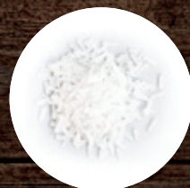
ГЛУТАМАТ НАТРИЯ (АДЖИНОМОТО) 160 Р/КГ