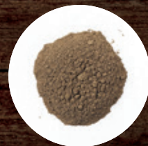
ПЕРЕЦ ЧЕРНЫЙ МОЛОТЫЙ В.С. 1506К 320 Р/КГ