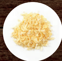
ЛУК СУШЕНЫЙ ХЛОПЬЯ 150 Р/КГ