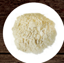
СОЯ (МУКА) СОЕВОГО БЕЛКА ЭКСТРАПРОТЕИН 210 Р/КГ