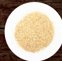
ЧЕСНОК ГРАНУЛИРОВАННЫЙ В АССОРТИМЕНТЕ, ФАС. 1 КГ 330 Р/КГ