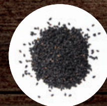
КУНЖУТНОЕ СЕМЯ ЧЕРНОЕ 220 Р/КГ