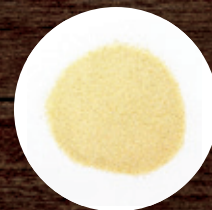
ЧЕСНОК ГРАНУЛИРОВАННЫЙ В АССОРТИМЕНТЕ ФАС. 25 КГ 290 Р/КГ