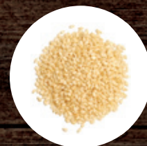
КУНЖУТНОЕ СЕМЯ БЕЛОЕ ЭКСТРА ОЧИСТКА 99.98 % 160 Р/КГ