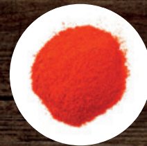
ПАПРИКА СЛАДКАЯ МОЛОТАЯ АСТА 240 Р/КГ