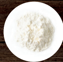
МОЛОКО СУХОЕ 26% 130 Р/КГ