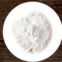
КРАХМАЛ КУКУРУЗНЫЙ 59 Р/КГ