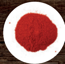
ПАПРИКА СЛАДКАЯ МОЛОТАЯ АСТА 250 Р/КГ