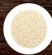
РИС ВОЗДУШНЫЙ БЕЛЫЙ F 200 3-5 MM 105 ₽/кг 169 ₽/кг