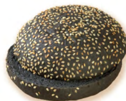
• хлебушек для сэндвича особый