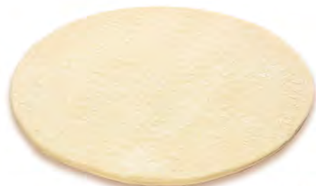
• тесто для пиццы