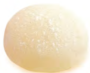
• тесто для пиццы