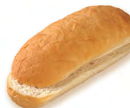
• булочка для хот-дога