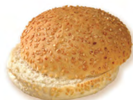
• булочка для бургера пшеничная с кунжутом