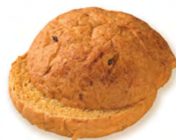
• хлебушек для сэндвича пряный