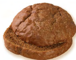
• хлебушек для сэндвича пшенично-ржаной