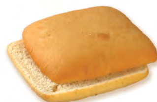
• панини пшеничная