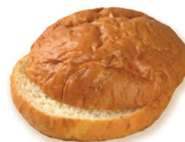
• хлебушек для сэндвича пшеничный